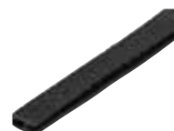
LSA 2/10 KS-120 (Art.-Nr. 24 01 36) Kantenschutzprofil für Montagewannen, Länge: 120 mm