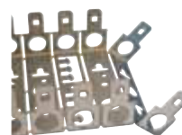
LSA 2/10-MW10-25/22 (Art.-Nr. 24 01 10) Montagewanne 10x 10DA (modular): Raster: 25 mm / Tiefe: 22 mm beliebig trennbar, bis zu einer Größe von 78 An- schlussmodulen lieferbar.