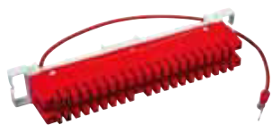
LSA 2/10-ER38-rot (Art.-Nr. 24 01 04) LSA-Erdrahtleiste zum Anschluss von 38 Erd- drähten oder Schirmen.