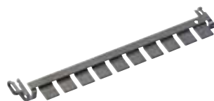
LSA 2/10-ES (Art.-Nr. 24 01 33) Erdungsschiene, steckbar: für 10 DA Anschluss- module als Verbindung zwischen Montagewanne und Überspannungsschutzstecker