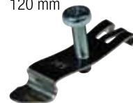
LSA DIN ADAPT (Art.-Nr. 24 01 37) Hutschienenadapter: Metallbügel mit M5-Gewin- de (ohne Schraube)