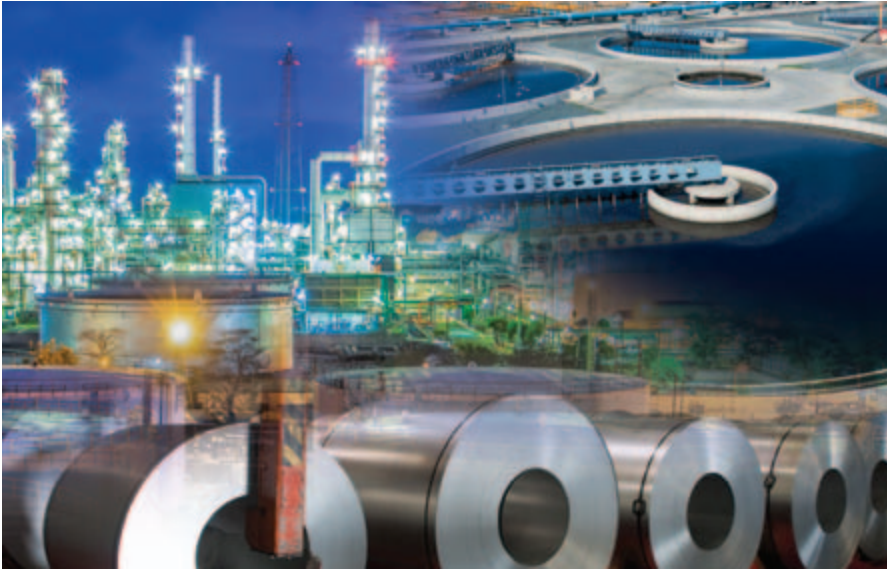
Die iQ Plattform ermöglicht die vollständige Integration von Steuerung und Kommunikation.